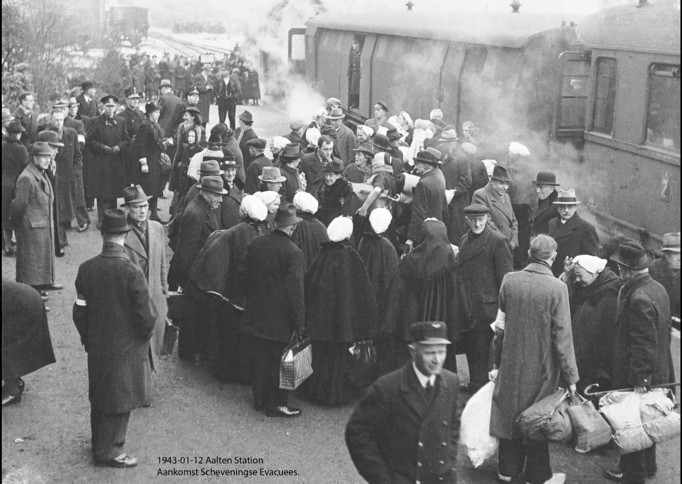
1943-01-12 Aalten Station Aankomst Scheveningse Evacuees.